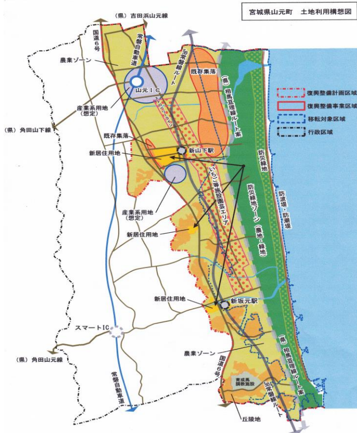
図3 山元町の移転対象区域と復興整備事業区域

・山元町は、震災復興計画において「コンパクトなまちづくり」(*4)を目指して、流失したJR常磐線を約1キロメートル内陸部に移設し、その新駅周辺地区3カ所での市街地形成と22行政区の集約化をかかげている。しかし、この間多くの被災住民から、JR線の内陸移転に対する異論を始め、県内ではいち早く指定した災害危険区域の見直し要求や集落単位の集団移転の要望等が相次いだ。そして2013年の12月議会では、町長は「町民との合意形成を図ろうとしない」ことなどを主旨とする問責決議が全会一致でなされた。この軋轢はひろがり、集団移転先用地の強制収用の問題も浮上し、同町が掲げる「コンパクトなまちづくり」の根底が揺らいでいる(図3)。