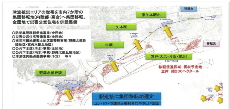
図4 東松島市防災集団移転計画（出所：東松島市資料）

・前述の「都市開発型復興」等の一方で、被災前からのコミュニティ・集落を基礎にした住民本位の復興まちづくりを進めている被災市町・地区もある。これには特別号（1）で紹介した岩沼市玉浦西地区を始め、東松島市及び七ヶ浜町の復興まちづくり、気仙沼市本吉町小泉地区などが該当する。 ・東松島市における移転促進区域内の移転戸数は、2,400世帯と県内最大の規模となったが、移転先のまちづくりの協議を先行させながら集団移転を推進している。被災世帯を市内7カ所の集団移転地（内陸部・高台）へ集約（JR線移設、駅近接地）し、各地区とも移転宅地と災害公営住宅を整備する。移転を機に他地区に移ることも可能とし、災害公営住宅のみの団地も計画している。集団移転事業の内容が固まった時期も早く、移転促進区域2,418戸の内、集団移転による住宅再建は1,288戸（対移転促進区域内住宅数53.3%）で、自力再建717戸、災害公営住宅入居571戸である。災害公営住宅団地は395戸（同16.3%）である（2014年7月）（図4）。